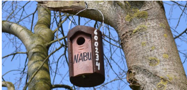
Nistkasten des NABU Lohne