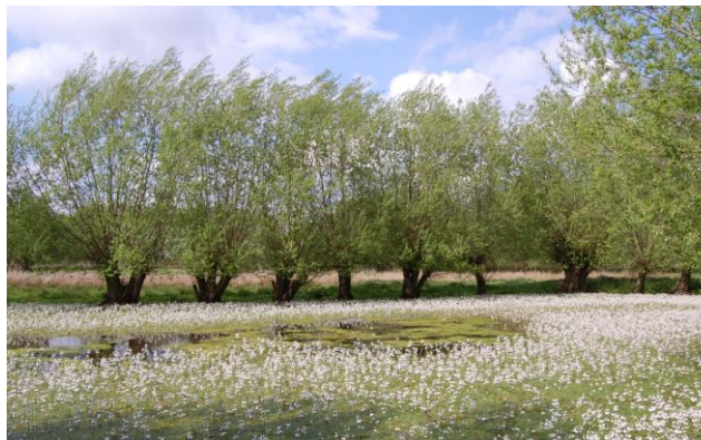
Wasserfeder-Blüte in einem von uns betreutem Gebiet beim Klünpott in Brockdorf