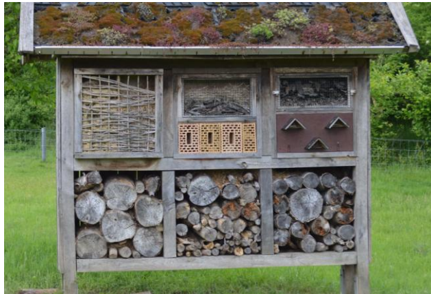
Insektenhotel in Südlohne